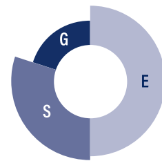
RÉPARTITION DES PONDÉRATIONS PAR PILIER