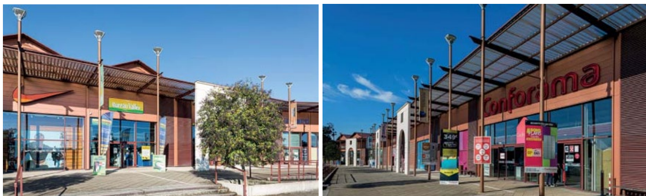
Retail Park Rives d'Arcins- Bègles (33) / Locataires principaux : Cultura, Décathlon, Maisons du Monde, Conforama, ...