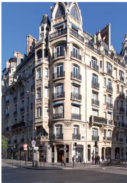
Paris - Rue de Courcelles

Avec Sofidy, société de gestion de SOFIBOUTIQUE vous bénéficierez de notre stratégie de l'emplacement, la clé selon nous de tout investissement réussi en immobilier. Depuis toujours, nous privilégions l'achat de biens rares, recherchés, situés dans des lieux à très forte activité. Nous plaçons ensuite des locataires sélectionnés et qui correspondent à la demande du marché. Si la demande change, nous accompagnons ces changements en adaptant l'actif aux nouvelles attentes.