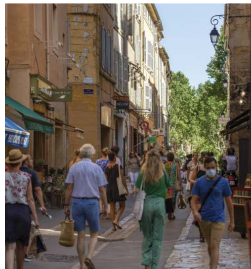
05. Levallois-Perret - Rue du Président Wilson